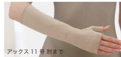
アクセス11号 肘まで